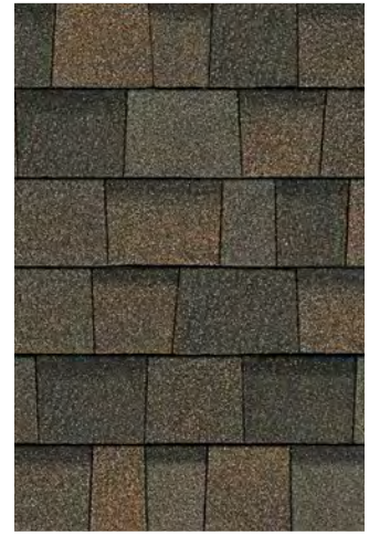
Smokey Mountain 1