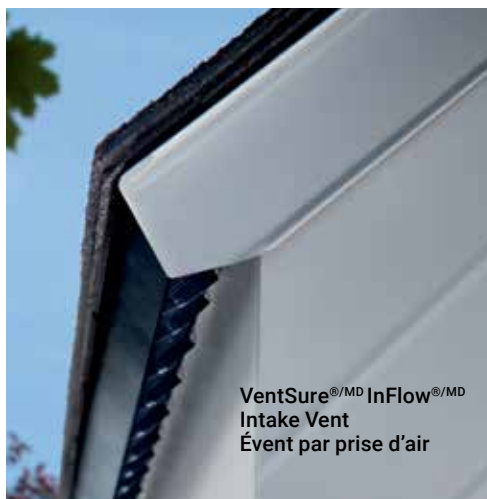
VentSure ®/MD InFlow ®/MD Intake Vent Évent par prise d'air