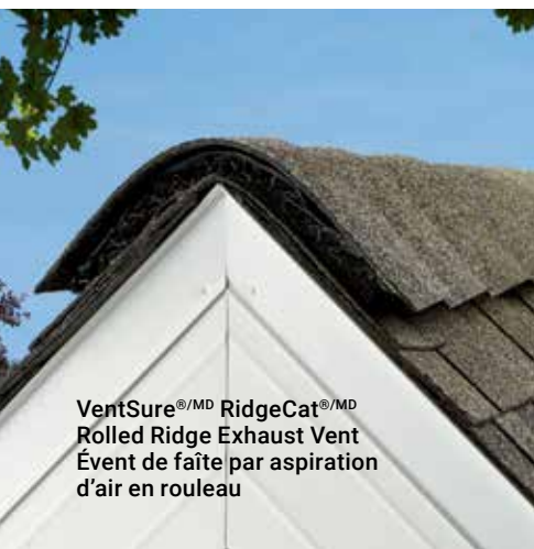
VentSure ®/MD RidgeCat ®/MD Rolled Ridge Exhaust Vent Évent de faîte par aspiration d'air en rouleau

Printed nailing tack lines eliminate guesswork Les lignes de clouage préimprimées facilitent grandement la pose